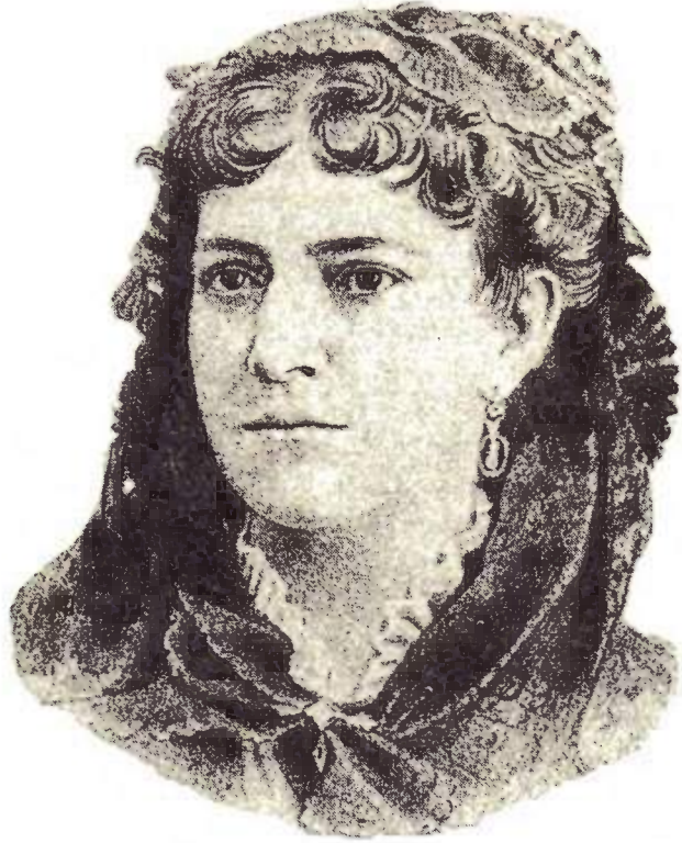
Retrato anónimo de Laureana Wright de Kleinhans, tomado de José María Vigil, Poetisas mexicanas. Siglos XVI, XVII, XVIII y XIX (edición facsimilar), México, Instituto de Investigaciones Filológicas-Centro de Estudios Literarios-Universidad Nacional Autónoma de México, 1977, p. 100.