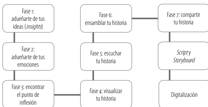
Figura 2. Fases en la construcción de un RDP

Las fases recursivas contempladas en el diseño de los relatos fueron las que se ilustran en la figura 2, de acuerdo con una adaptación de Lambert (2010) y de algunos principios de Ohler (2013):