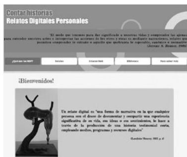
Figura 3. Secciones del sitio web: < http://grupogiddet.wix.com/rdpogiddet >

La página de inicio ofrece a los cibernautas interesados una bienvenida en la que se define lo que entendemos por RDP y se habla del proyecto (figura 3). Las entradas incluyen lo siguiente: relatos (donde se ofrece la colección de RDP); Enlaces web; Biblioteca; Diseña tu relato; Comparte tu relato; Autores, y Contacto con los autores del sitio. Una breve descripción de cada una de dichas entradas se incluye en la tabla 2.